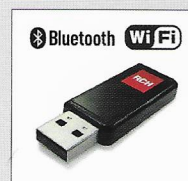
USB Connection Dongle USB combo Wi-Fi Bluetooth