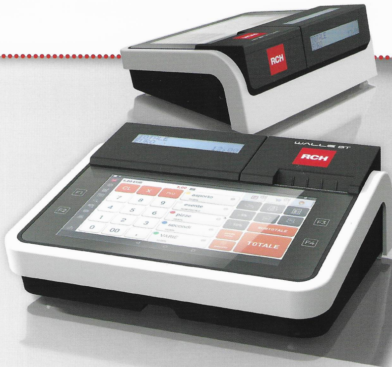
8-Zoll-TFT-Farbvideotastatur, kapazitiver Touchscreen, große Helligkeit bei einer Auflösung von 1024 x 600